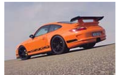
"Eine ähnliche Bedeutung wie der Porsche": Statussymbol Clubmitgliedschaft

Gradinger: Es gibt sicher auch Mitglieder, die ihrem Club aus Statusgründen angehören. Solche Mitglieder tragen sehr gerne und selbstbewusst die Clubnadel am Revers. Für sie hat diese Nadel ähnliche Bedeutung wie für andere der Porsche. In jedem Fußballverein gibt es passive Mitglieder, die sich nicht richtig engagieren, aber begeistert den Vereinsschal zur Schau tragen.